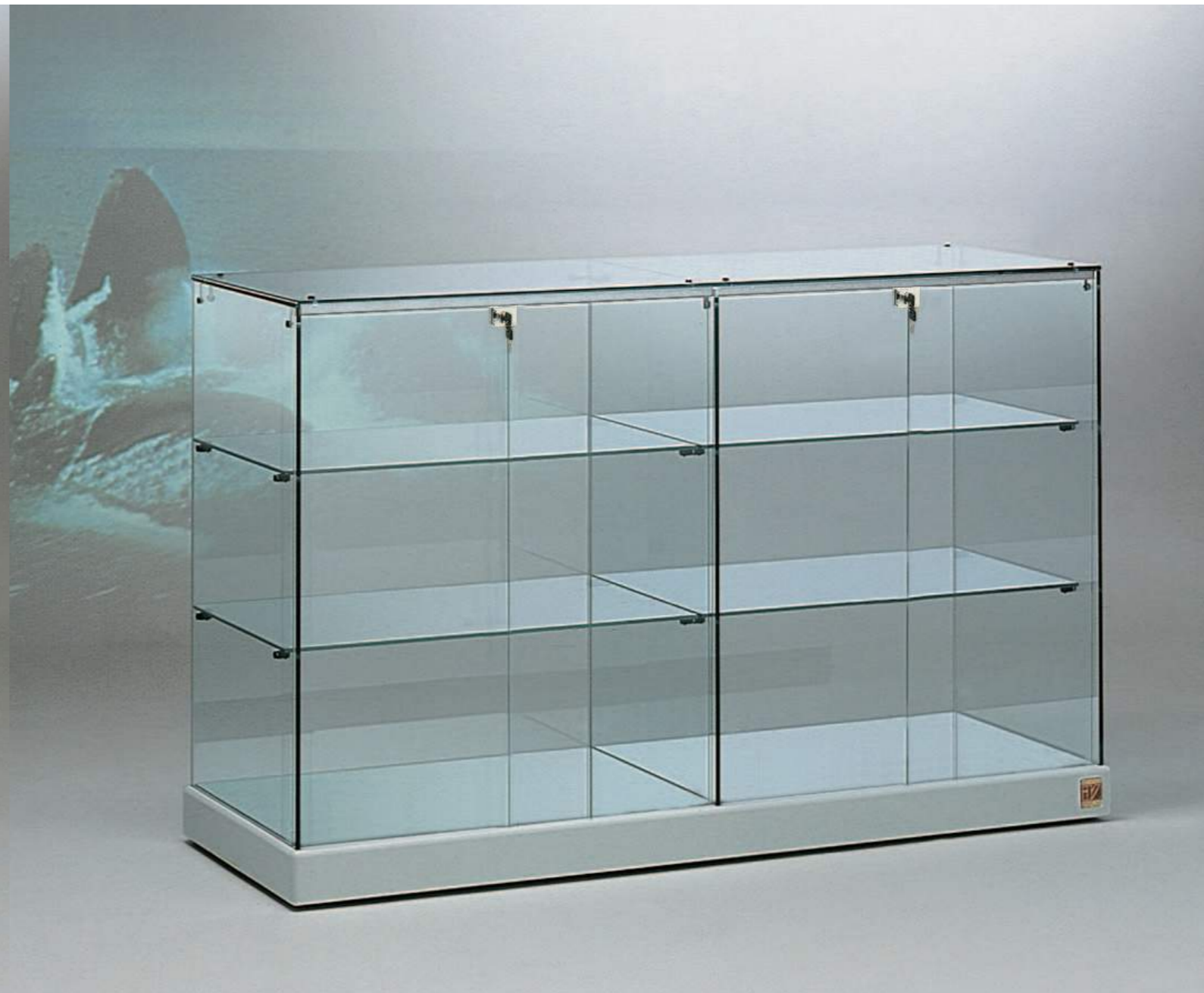
art. 140/B (cm 143x46x90h)