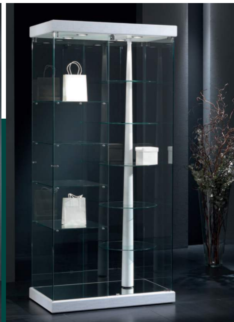
art. 90/G (cm 93x53x200h) vetrina con ripiani girevoli elettricamente