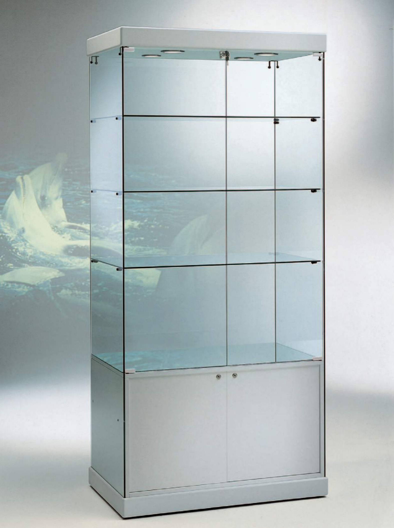
art. 90/SM (cm 93x53x200h)