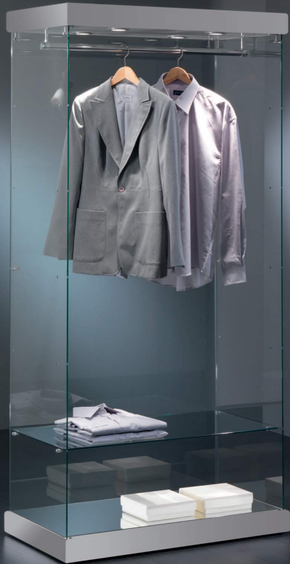
art. 90/SA (cm 93x53x200h)