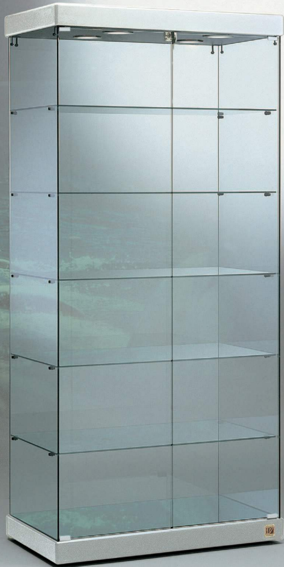
art. 90/S (cm 93x53x200h)