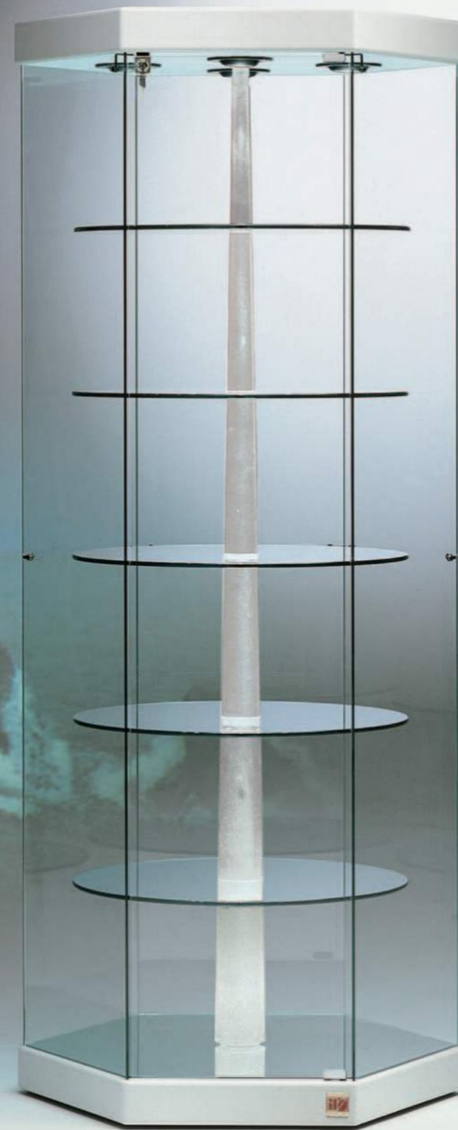
art. 201/GB (cm Ø74x200h) vetrina con ripiani girevoli elettricamente