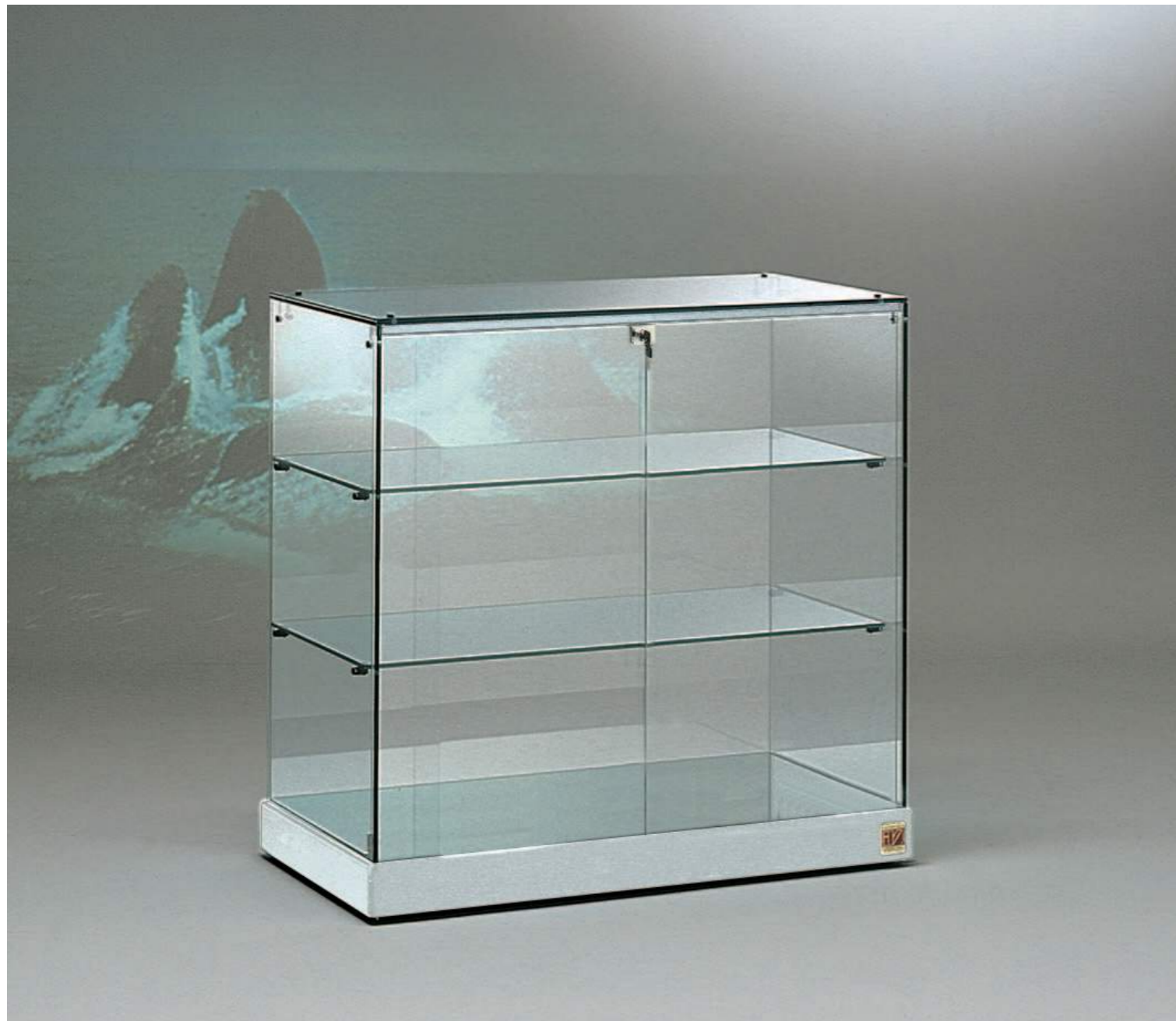
» 86 _ art. 90/B (cm 93x46x90h)

black & white BANCHI E VETRINE PER ARREDAMENTO