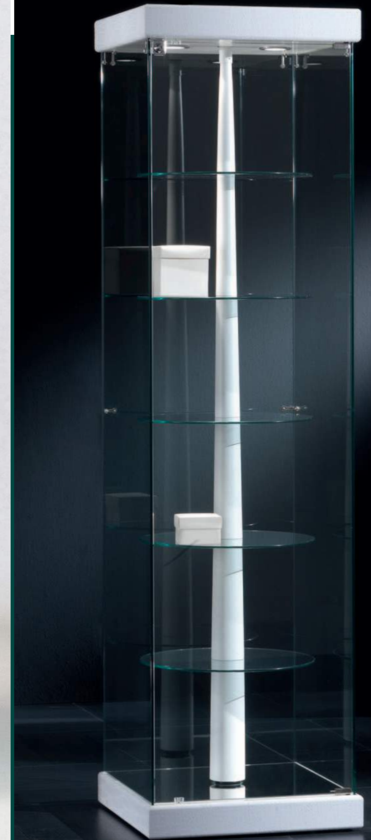
art. 140/S (cm 143x53x200h)