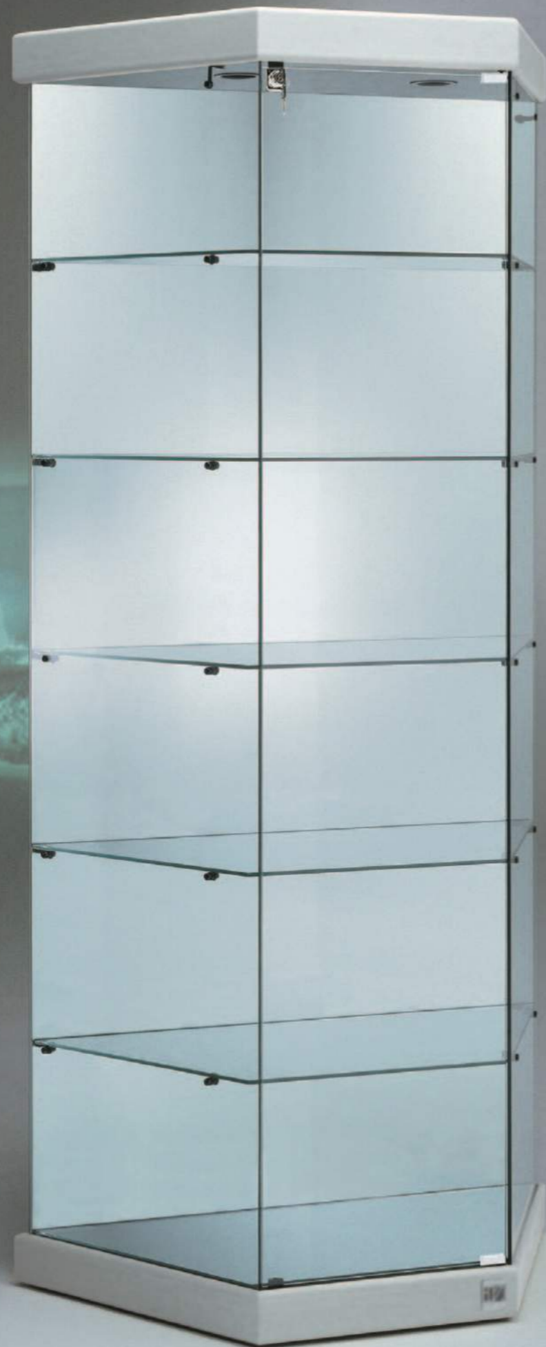
art. 251/M (cm 93/44x43x200h)

ESEMPI ART. 251/M CON FINITURA ECOPELLE COCCODRILLO MARRONE ART. 9/TR EXAMPLES OF ART. 251/M IN BROWN CROCODILE IMITATION LEATHER FINISH, ART. 9/TR