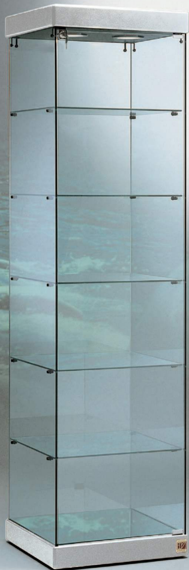
art. 50/S (cm 54x53x200h)

ESEMPI ART. 50/S CON FINITURA ECOPELLE CROMO, COCCODRILLO MARRONE ART. 5/S EXAMPLES OF ART. 50/S IN CHROME, BROWN CROCODILE, IMITATION LEATHER FINISH, ART. 5/S