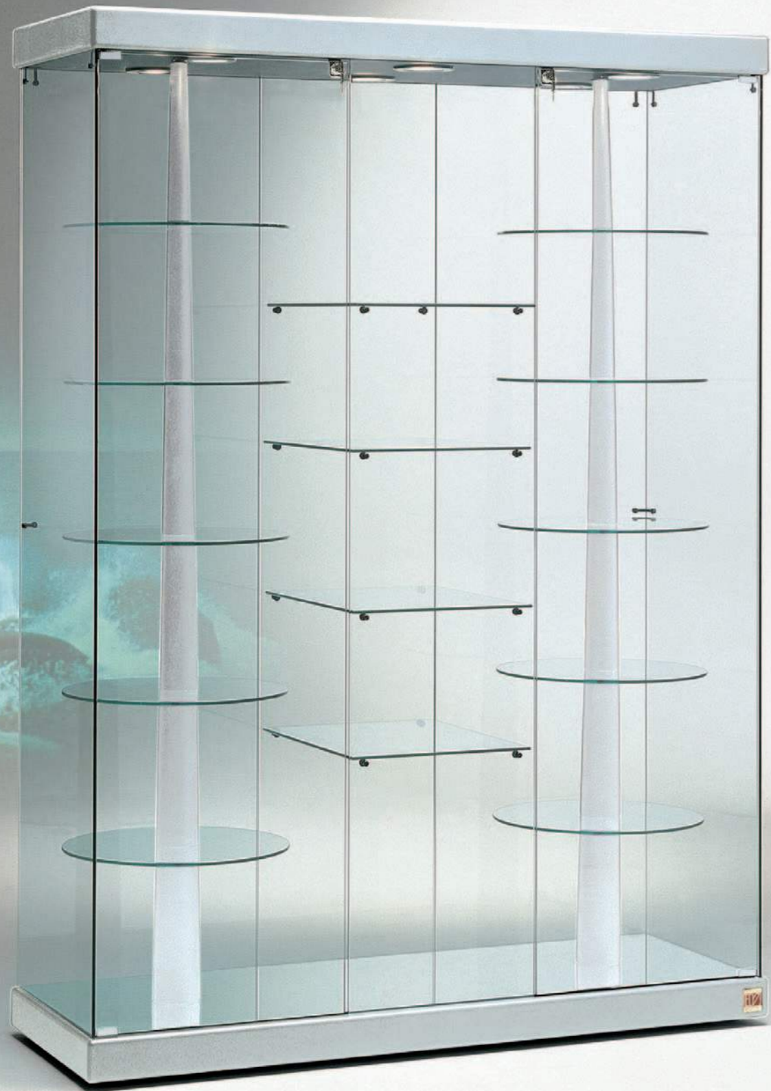
art. 140/G (cm 143x53x200h) vetrina con ripiani girevoli elettricamente Con finitura Ecopelle Cromo, Coccodrillo Bianco, Coccodrillo Marrone art. 14/G In Imitation Leather Finish Chrome, White Crocodile, Brown Crocodile art. 14/G