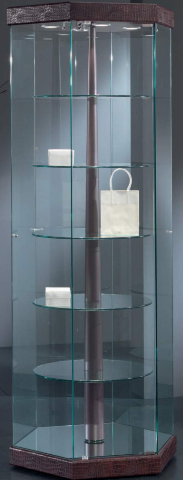
ESEMPIO CON FINITURA ECOPELLE COCCODRILLO MARRONE, ANCHE IN COCCODRILLO BIANCO E CROMO ART. 7/G EXAMPLE IN BROWN CROCODILE, ALSO IN WHITE CROCODILE, CHROME IMITATION LEATHER FINISH ART. 7/G