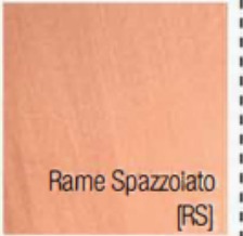
Rame Spazzolato [RS]