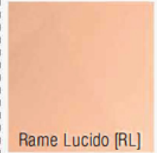
Rame Lucido [RL]