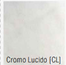
Cromo Lucido [CL]