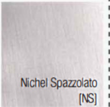
Nichel Spazzolato [NS]