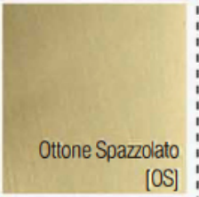
Ottone Spazzolato [OS]