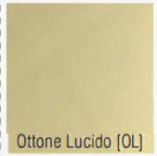
Ottone Lucido [OL]