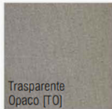
Trasparente Opaco [TO]