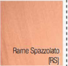
Rame Spazzolato [RS]