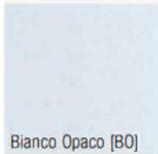
Bianco Opaco [BO]