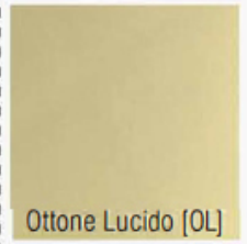
Ottone Lucido [OL]