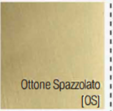
Ottone Spazzolato [OS]