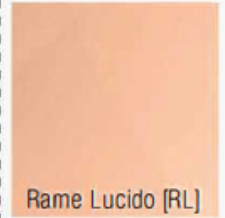
Rame Lucido [RL]