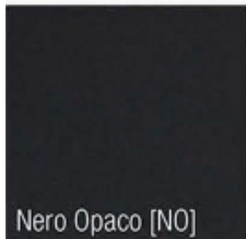
Nero Opaco [NO]