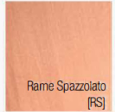
Rame Spazzolato [RS]