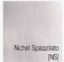
Nichel Spazzolato [NS]