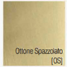
Ottone Spazzolato [OS]