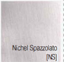
Nichel Spazzolato [NS]