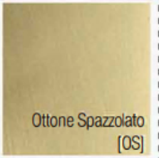
Ottone Spazzolato [OS]