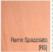
Rame Spazzolato [RS]