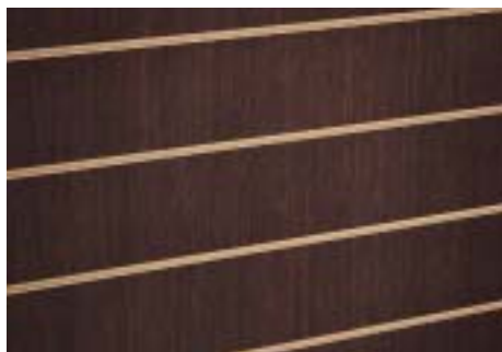
Wengé - Wengé