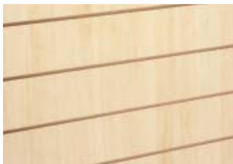
Ahorn - Maple

Art. 70.102T - Distanz der Fräsungen 15 cm - Distance between grooves 15 cm