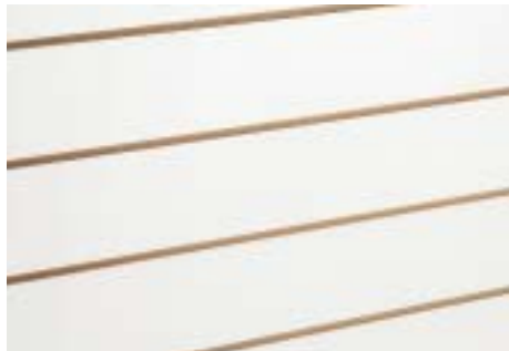
Weiss - White

Art. 70.100T - Distanz der Fräsungen 15 cm - Distance between grooves 15 cm