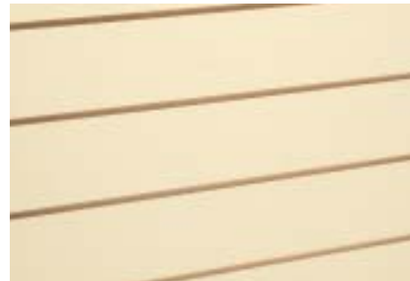
Crème - Cream

Art. 70.102T - Distanz der Fräsungen 15 cm - Distance between grooves 15 cm