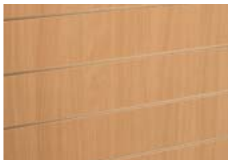
Buche - Beech