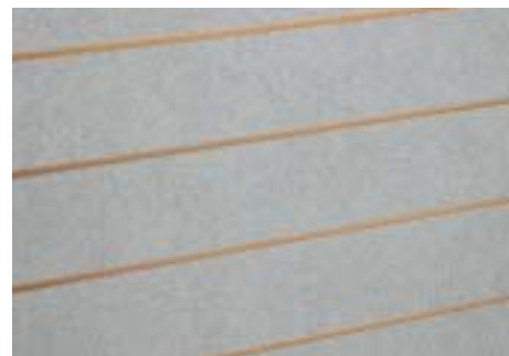
Granit hell - Light granite