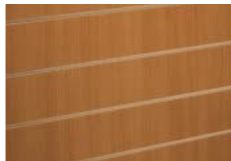
Braun (nuss) - Natural walnut