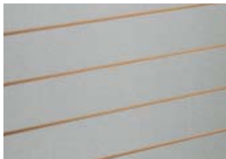
Alu-farbig - Alu effect