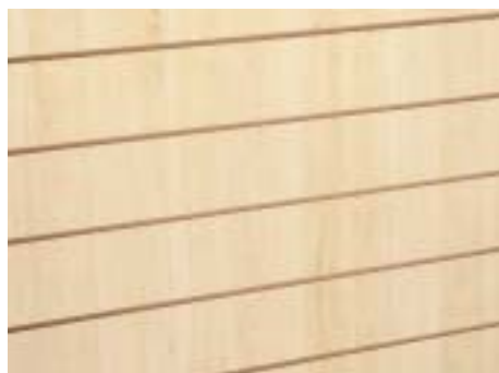
Ahorn - Maple

Distanz der Fräsungen 10 cm Distance between grooves 10 cm