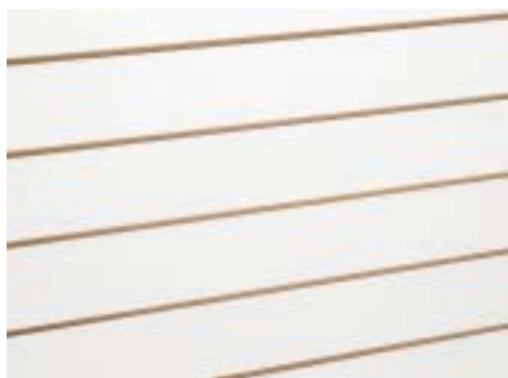
Weiss - White

Distanz der Fräsungen 10 cm Distance between grooves 10 cm