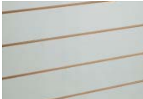
Grau - Grey